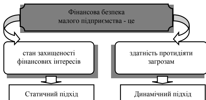
Рис. 2. Основні підходи до трактування поняття "фінансова безпека малого підприємства"