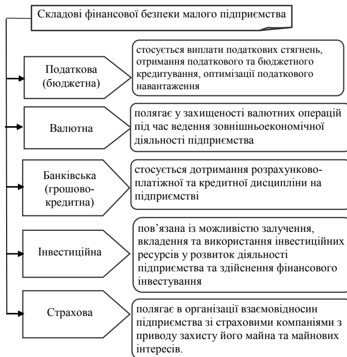
Рис. 4. Складові фінансової безпеки малого підприємства

Стосовно виділення видів загроз фінансовій безпеці підприємства, то у даному аспекті слід виокремити напрацювання Крупки А. С. та Яструбецької М. І. [9, с. 30—32], які запропонували одинадцять класифікаційних ознак (за рівнем фінансової діяльності, сферою виникнення, об'єктом, суб'єктом, джерелом виникнення, характером прояву, способом виникнення, строковістю, рівнем ймовірності, фінансовими наслідками та можливістю передбачення), а також Меліхової Т. О. [4, с. 43], якою запропоновано сімнадцять таких ознак (за середовищем, характером, причиною, ймовірністю появи, періодом та причиною виникнення, рівнем суттєвості, ймовірністю попередження, ступенем безпеки, терміном дії, формою збитку, місцем та масштабом виникнення, ступенем імовірності, типом злочину, суб'єктом та вірогідністю усунення).