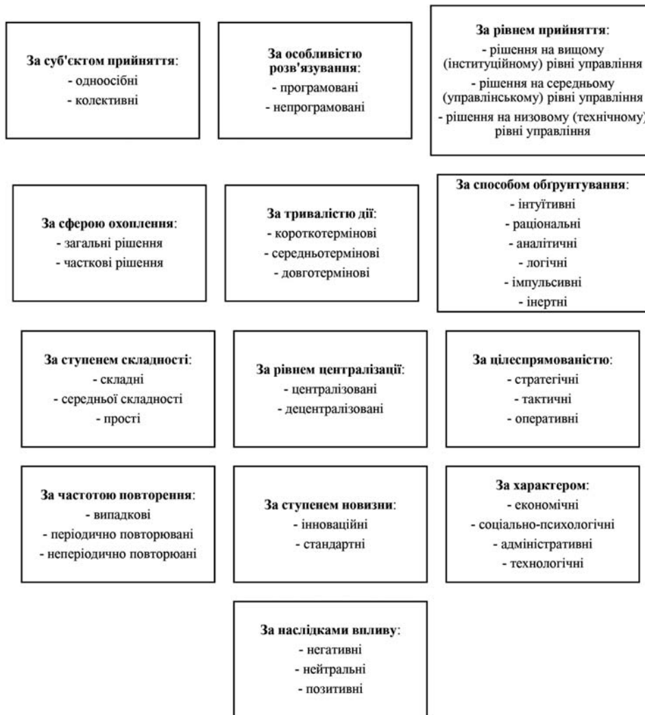
Рис. 2. Класифікація видів управлінських рішень