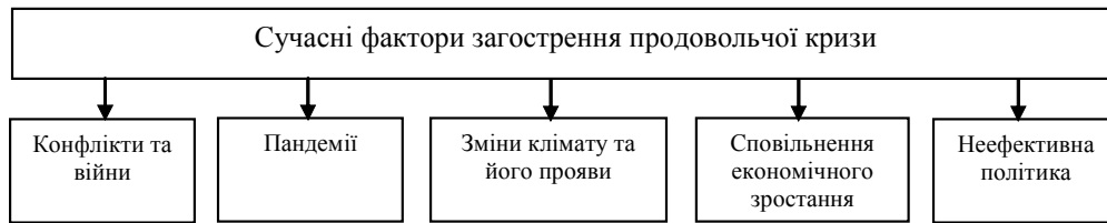
Рис. 2. Фактори загострення продовольчої кризи в Україні та світі