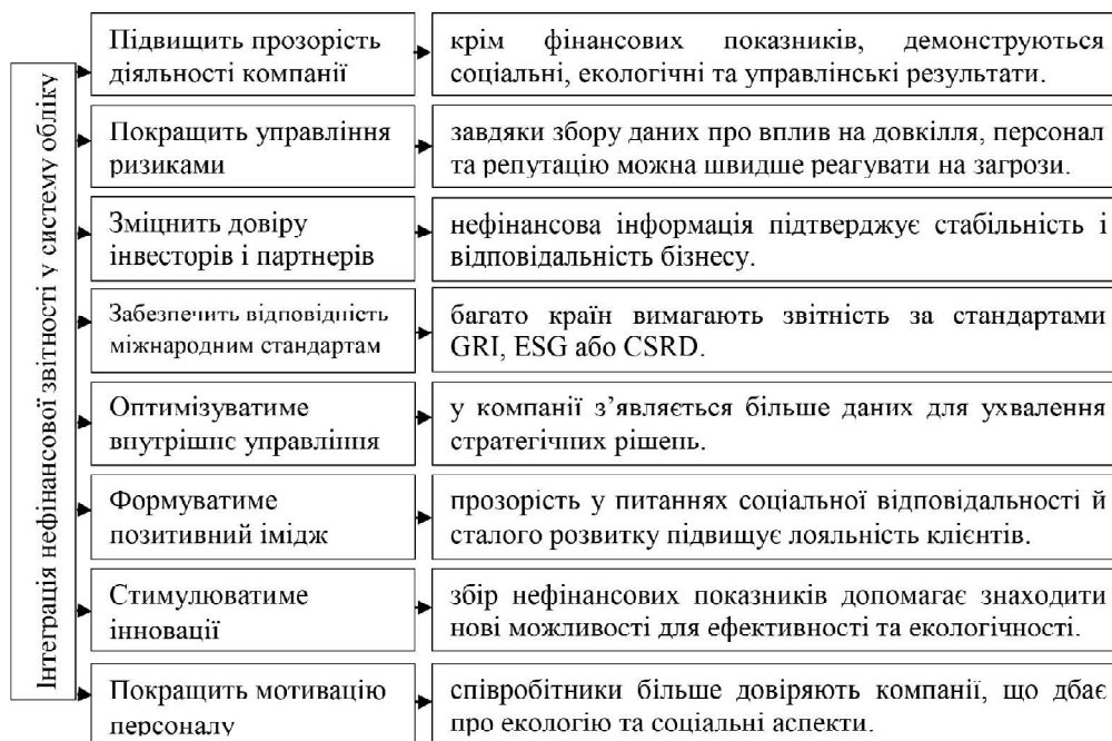
Рис. 2. Інтеграція нефінансової звітності у систему обліку