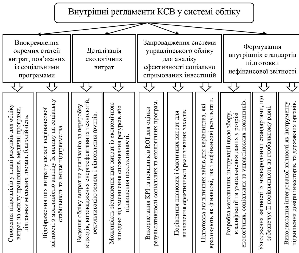
Рис. 3. Внутрішні регламенти КСВ у системі обліку