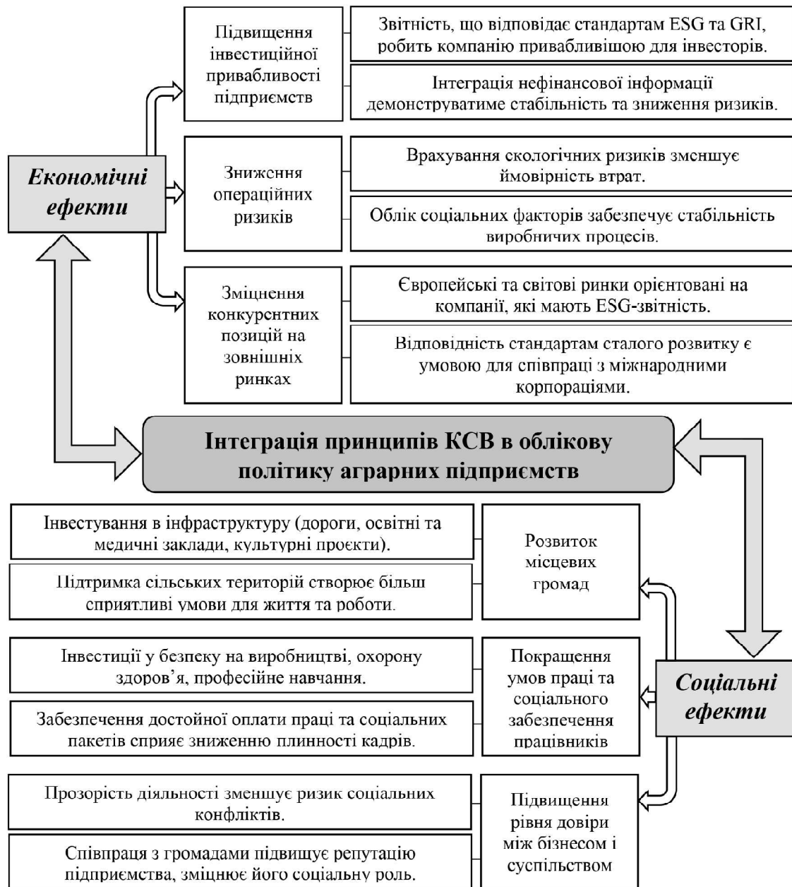
Рис. 4. Інтеграція принципів КСВ в облікову політику аграрних підприємств