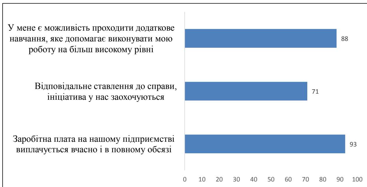
Рис.1. Рівень мотивації та стимулювання праці медичних працівників ЦПМСД № 2 (%)