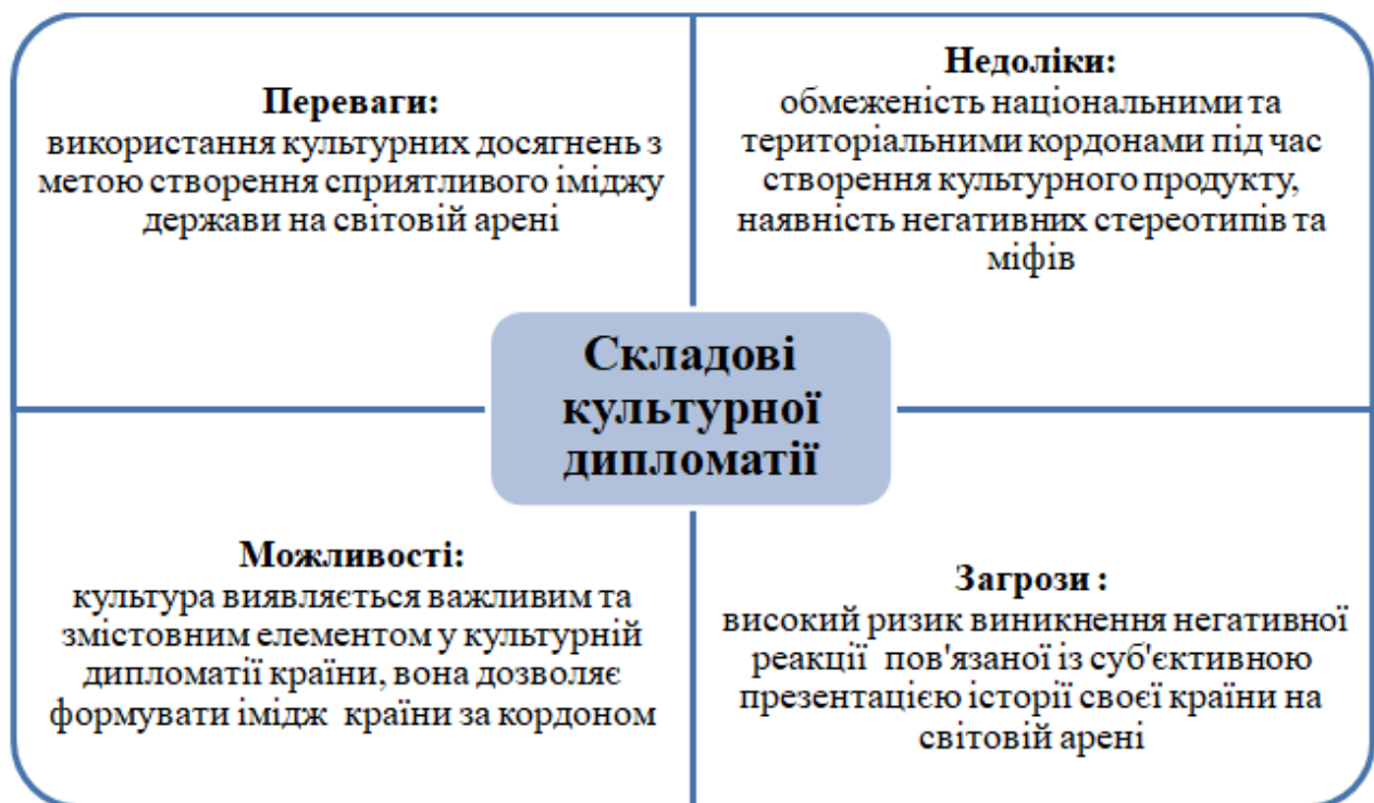
Рис. 1. Складові культурної дипломатії

Культурна дипломатія має переваги, недоліки так і можливості і загрози які представлено на рисунку 1.