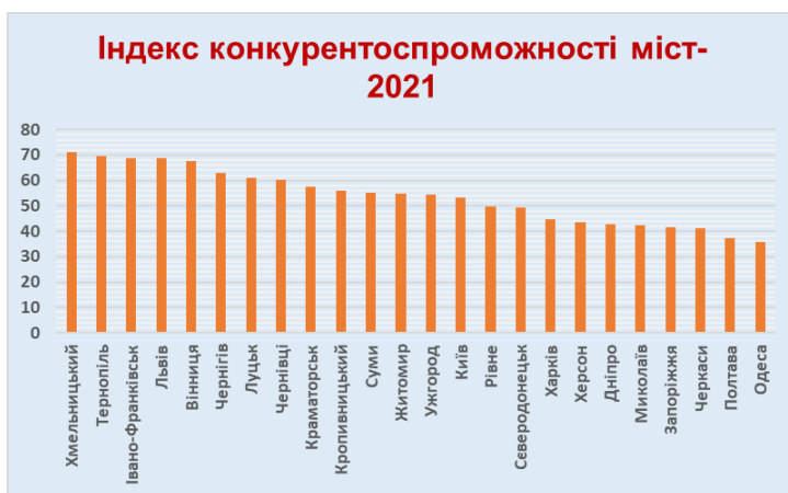
Рис. 2. Індекс конкурентоспроможності міст-обласних центрів 2021

На підставі статистичних даних та опитування (інтерв'ю) було сформовано Індекс конкурентоспроможності міст для центрів областей 2021. Зведені дані ІКМ-2021, які продемонстровані на рис. 2, засвідчують той факт, що найвищий індекс конкурентоспроможності досягли міста-обласні центри Хмельницький та Тернопіль. Саме ці області брали найактивнішу участь у процесі децентралізації.