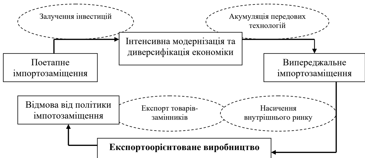
Рис. 4. Циклічний характер взаємозв'язків між імпортозаміщенням та стимулюванням експорту

пріоритетних секторів економіки. При досягненні точки оптимуму захисні бар'єри необхідно знижувати. Спектр застосування стратегії імпортозаміщення повинен бути скоригований за найважливішими секторами, оскільки його значне розширення поглиблює замкненість національної економіки стосовно глобального економічного простору, що може викликати втрату інтеграційних переваг і зумовити ефект негативного синергізму [31, с. 46].