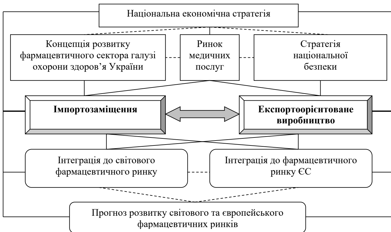
Рис. 1. Стратегічні орієнтири, що визначають характеристики імпортозаміщення на фармацевтичному ринку України

світових виробників фармацевтичної продукції, показники імпорту перевищують у відсотковому співвідношенні обсяг продукції місцевого виробництва [2, с. 26]. Враховуючи об'єктивну залежність національного фармацевтичного ринку від імпорту лікарських засобів, при розробці стратегії імпортозаміщення необхідно враховувати тенденції розвитку ринку медичних послуг, прогноз розвитку світового фармацевтичного ринку, а також напрями узгодження з національною економічною стратегією, стратегією розвитку фармацевтичної галузі, стратегією національної безпеки України, з політикою євроатлантичної інтеграції і гармонійної інтеграції до системи світогосподарських зв'язків та орієнтуватися передусім на вимоги удосконалення системи охорони здоров'я і забезпечення потреб населення в якісній фармацевтичній продукції (рис. 1).