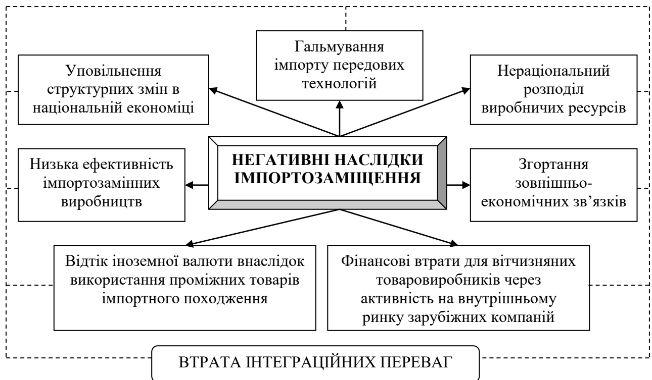
Рис. 3. Негативні прояви імпортозаміщення