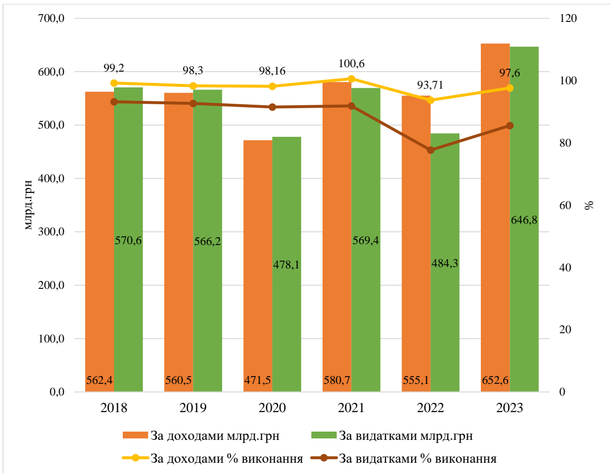
Рис. 2. Виконання місцевих бюджетів за доходами та видатками в Україні, 2018-2023 рр.

Джерело: сформовано автором на основі [13]