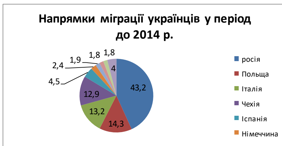
Рис 1. Напрямки міграції українців у період до 2014 р.

країни, або за її межами у пошуку кращих умов праці. До того ж, мігрували в основному чоловіки. На жаль, неможливо визначити точну кількість зовнішніх мігрантів до початку АТО, адже статистика та соціологічні опитування не дають повної картини міграційних процесів в країні. У мирний час в Україні було двічі проведено всеукраїнські опитування лише двічі – у 2008 та 2012 роках. За даними опитування Інституту демографії та соціальних досліджень ім. М.В. Птухи Національної академії наук України (ІДСДП НАН України), за кордоном у період з 2005 по 2008 рік працювало 1.5 млн громадян України, що на той момент становило близько 5.1% працездатного населення. А згідно з опитуванням, проведеним Держкомстатом спільно з ІДСДП НАН України у 2012 році, за кордоном працювали 1.2 млн українців (приблизно 3,4%) працездатного населення. Важливо також зазначити, що основною групою мігрантів у мирний час були чоловіки (більше 60% від загальної кількості) віком від 25 до 49 років, тобто особи, що змогли отримати певні кваліфікаційні навички в Україні та здобути певний робочий досвід. Як би парадоксально це не було, та аж цілих 43,2% трудових мігрантів виїжджали до росії, і лише 14,3% - до Польщі. Також популярними напрямками трудової міграції українського населення були Італія та Чехія, меншою мірою – Іспанія, Німеччина, Угорщина, Португалія та Білорусь (рис. 1) [2]