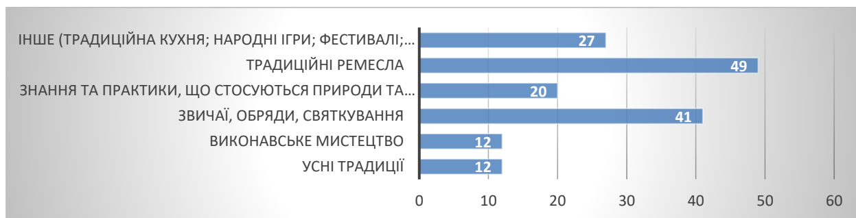
Рис. 2 Кількість елементів, що набули статусу НКС України після 24.02.2022 р., відповідно до галузей, визначених Конвенцією та Порядком ведення Національного переліку

Найчисельнішою (у кількості 49 елем.) сформувалася галузь традиційних ремесел (1 місце у рейтингу); до галузі збереження звичаїв, обрядів, святкувань увійшло – 41 елем. (2 місце). Третя група під назвою «інше» у кількості 27 елем. об'єдналися традиційна (кухня, ігри, медицина, музика, промисли); фестивалі та культурні простори, серед яких; 20 елем. з галузі знань та практик, що стосуються природи та всесвіту (3 місце); по 12 елем. (4 та 5 місце) займає виконавське мистецтво та галузь усних традицій (Рис. 2).