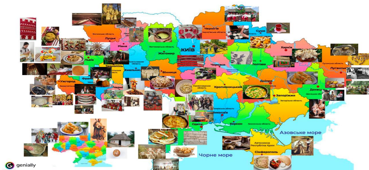
Рис. 3. Інтерактивна карта елементів НКС України часів воєнного стану*