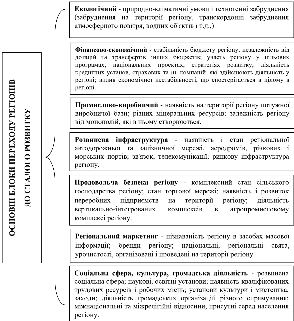
Рис. 2. Загальна характеристика основних блоків переходу регіонів до сталого розвитку