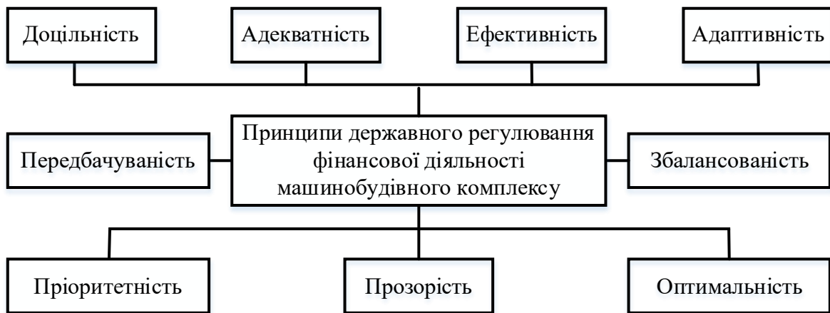
Рис.1. Принципи державного регулювання фінансової діяльності машинобудівного комплексу

- принцип адекватності означає, що заходи регулювання мають бути пропорційними до викликів і ризиків, які виникають у галузі, забезпечуючи рівновагу між державним контролем і свободою бізнесу;