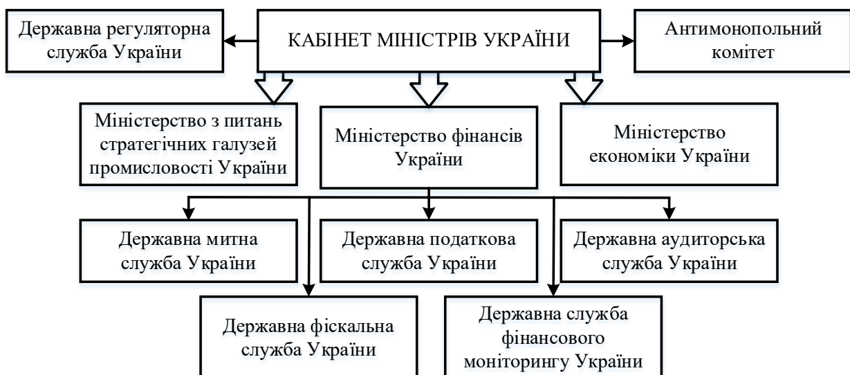
Рис. 4. Інституційна структура державного регулювання фінансової діяльності машинобудівного комплексу України

Створення умов стабільного фінансування машинобудівного комплексу значною мірою залежить від інструментів організаційного механізму. При цьому, ключову роль відіграє інституційне середовище державного регулювання фінансової діяльності машинобудівного комплексу України (рис. 4).