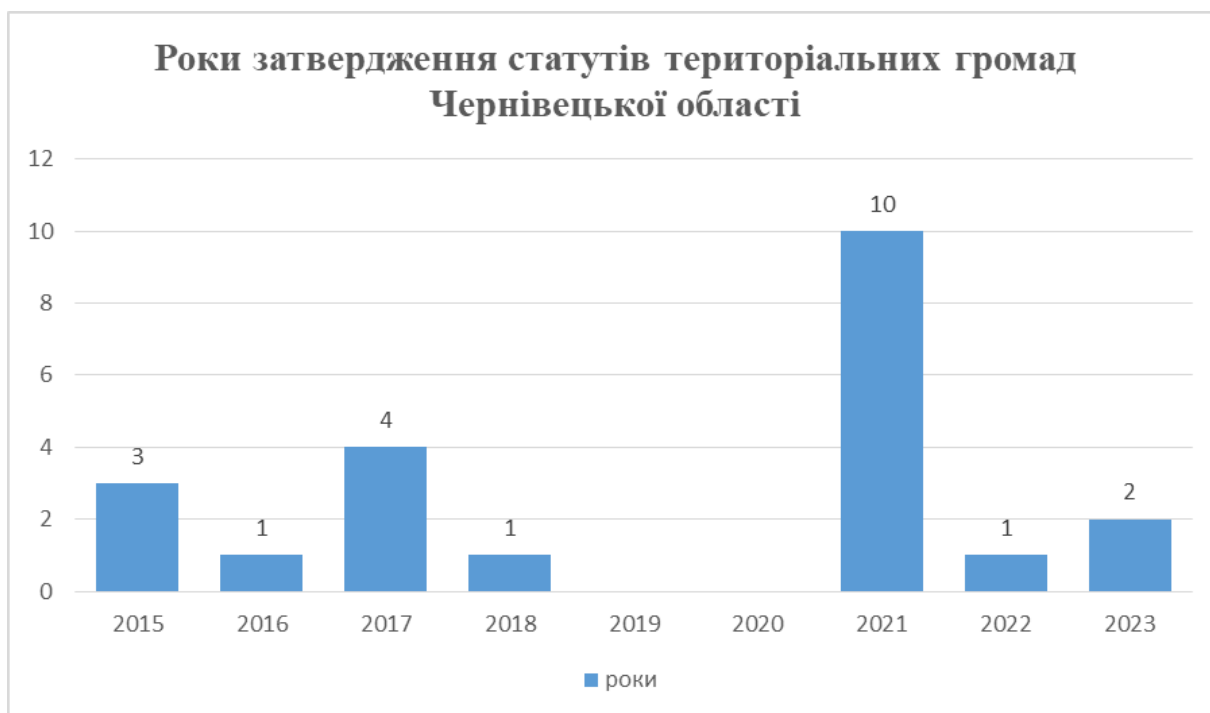
Рис. 2. Роки затвердження статутів територіальних громад Чернівецької області станом на грудень 2024 року

Відсутність належної динаміки осучаснення базового нормативно-правового акту відображено на рис 2.