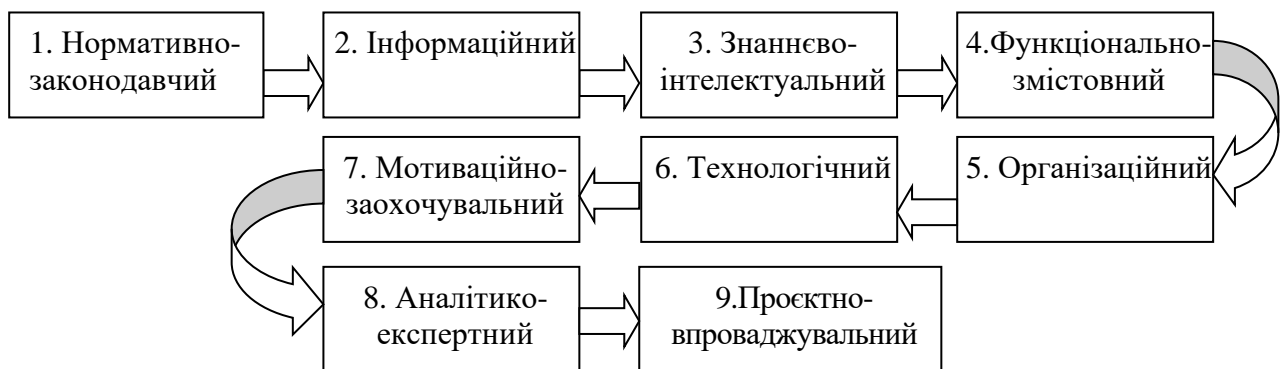
Рис. 2. Складові компоненти комплексного інтегрованого процесу інноваційної розбудови й оновлення змісту і структури системи державного управління

Для дослідження властивостей системи державного управління за її основними складниками на державному і місцевому рівнях була розроблена структура комплексного інтегрованого процесу інноваційної розбудови і оновлення змісту і структури системи державного управління (рис. 2). Розглянемо зміст складників як відносно самостійних сукупностей блокових елементів, які можуть реалізувати цей процес за всіма етапами управлінського циклу. Останні розрізняються структурою, змістом, технологіями та інструментарієм системи управління, їх логічною послідовністю, змістовно-діяльними, ресурсними і забезпечувальними компонентами послідовності їх застосування.