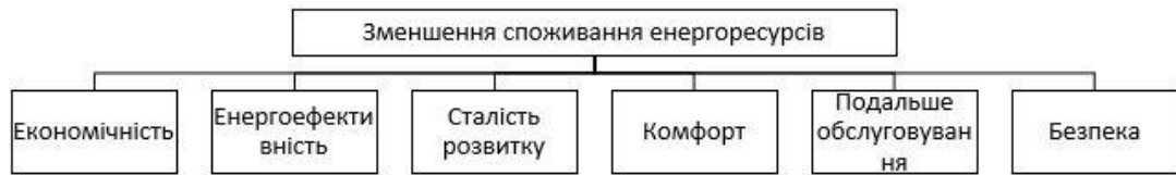
Рисунок 1. Ієрархічна модель цілей та критеріїв