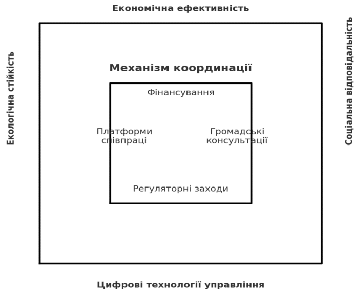
Рис. 2. Механізми координації [15]

Посилення інституційної спроможності громад через навчальні програми та підготовку спеціалістів у сфері місцевого самоврядування є ще одним важливим кроком у напрямку вдосконалення координаційних механізмів. Враховуючи складність і багаторівневість процесів відновлення, громади потребують кваліфікованих управлінців, здатних ефективно реалізовувати стратегічні плани розвитку. Організація навчальних курсів, обмін досвідом з іншими країнами та впровадження програм підготовки спеціалістів з управління відновлювальними процесами сприятиме зміцненню кадрового потенціалу місцевого самоврядування.