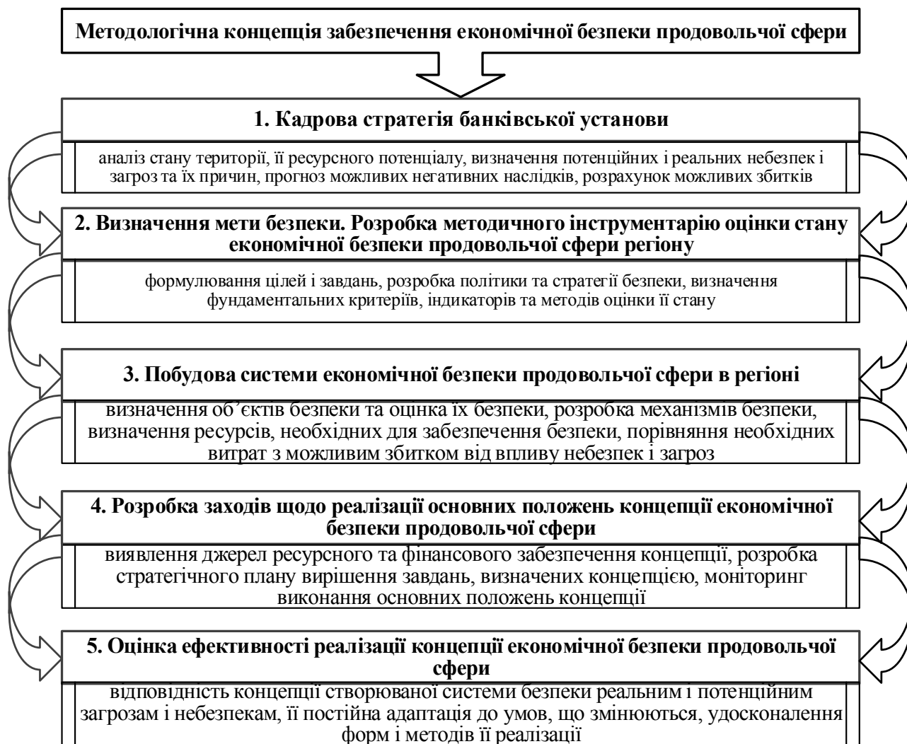
Рис. 2. Методологічна концепція забезпечення економічної безпеки продовольчої сфери

– собівартість та ефективність виробництва різних видів продовольства в конкретному регіоні;