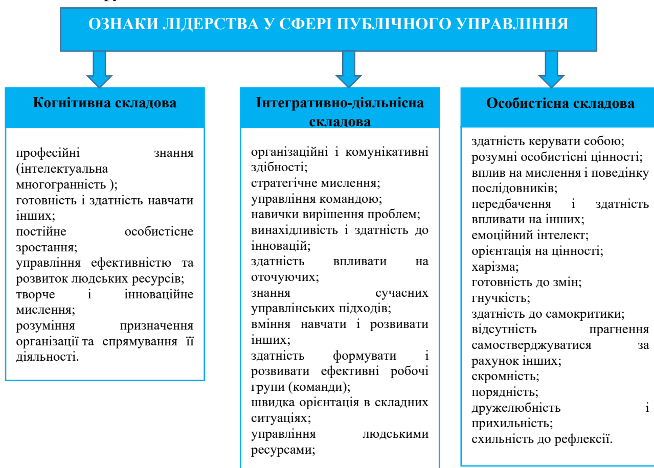
Рис. 3. Структура критеріальних ознак лідерства у сфері публічного управління та адміністрування

когнітивно-емоційні; морально-вольові; соціально-комунікативні; соціально-особистісні; функціональні.