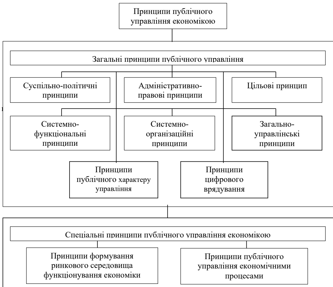
Рис. 2. Типологія принципів публічного управління економікою

адміністративно-правові; цільові; системно-функціональні; системно-організаційні; загально-управлінські; принципи публічного характеру управління; принципи цифрового врядування.