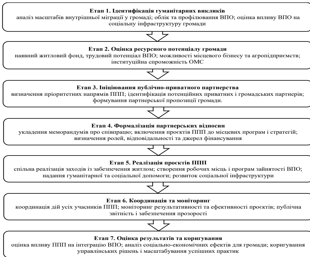
Рис. 1. Алгоритм дій органу місцевого самоврядування щодо впровадження PPP для підтримки ВПО у сільських територіях