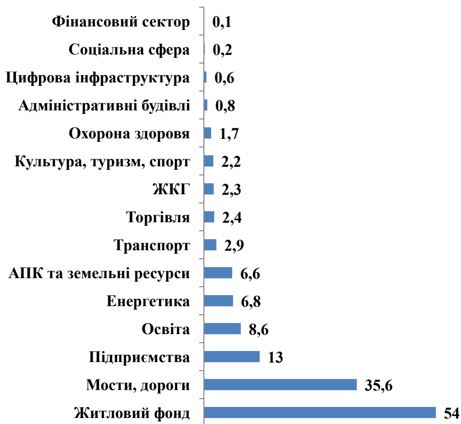
Рис. 2. Загальні збитки інфраструктури по галузям станом на кінець грудня 2022 року, млрд дол. США[9]

Найбільше зростання збитків у грудні 2022 року пов'язано з руйнуванням житлових об'єктів, мостів, доріг, підприємств та освітніх закладів (рис. 2).