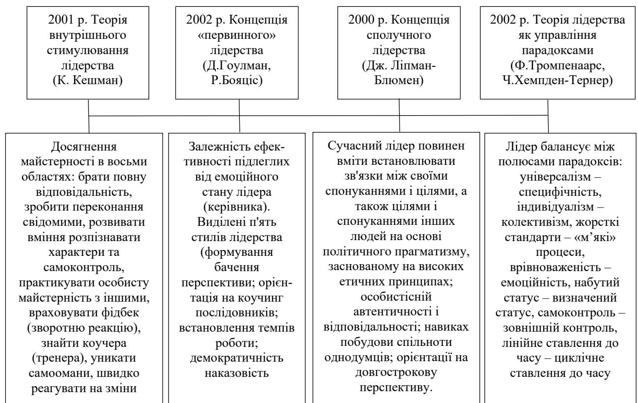
Рис. 2. Теорії управління початку XXI століття

поняття «емоційний інтелект», який характеризує здатність людини розпізнавати емоції, розуміти наміри, мотивацію та бажання інших людей і керувати емоціями задля вирішення поставлених завдань» [15, с. 118]. Усе це плюс розвиток мережевих технологій сприяє появі на початку XXI ст. нових теорій управління: внутрішнього стимулювання лідерства, концепція «первинного» лідерства, концепція сполучного лідерства, теорія лідерства як управління парадоксами (рис. 2).