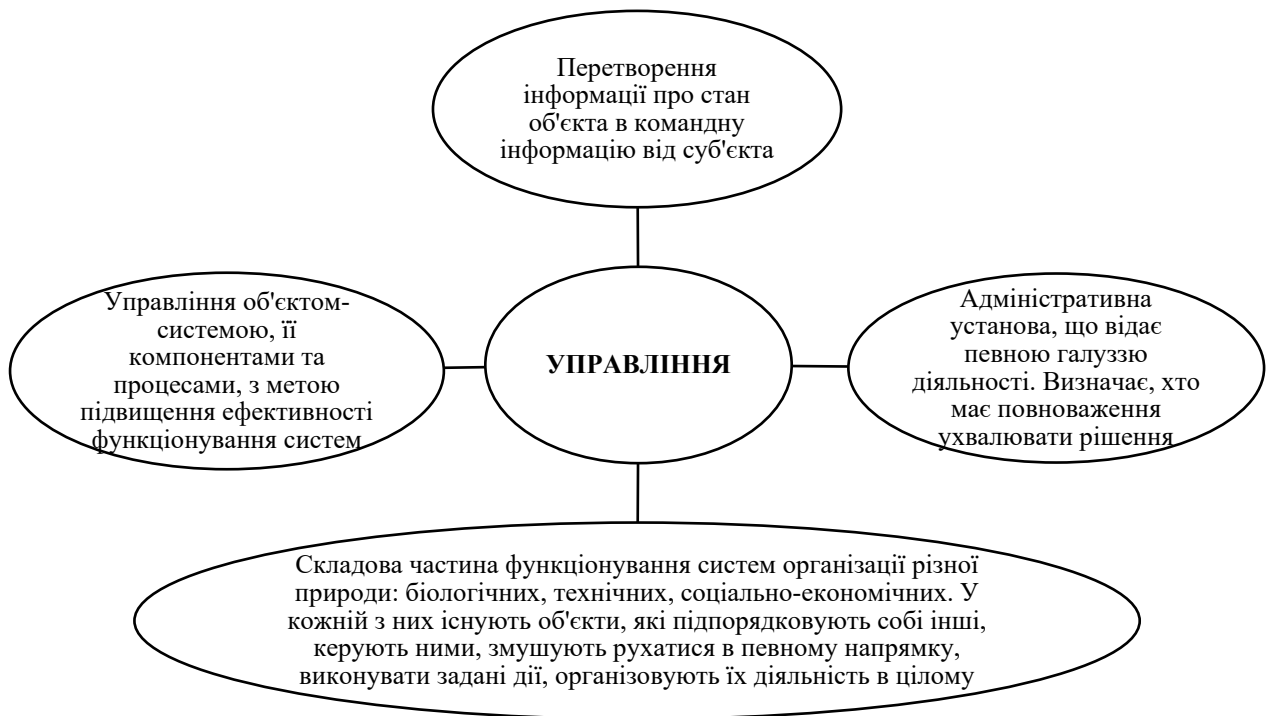
Рис. 1. Значення терміну управління

проголосив принцип універсального управлінського процесу. Його учень Платон виклав ідеї мислителя у книзі «Апологія Сократа» і розмежував функції органів управління. Одна із головних ідей Піфагора, полягала у тому, що в основі науки управління людьми повинно бути містичне покликання до керівництва з раціональним його обґрунтуванням [17].