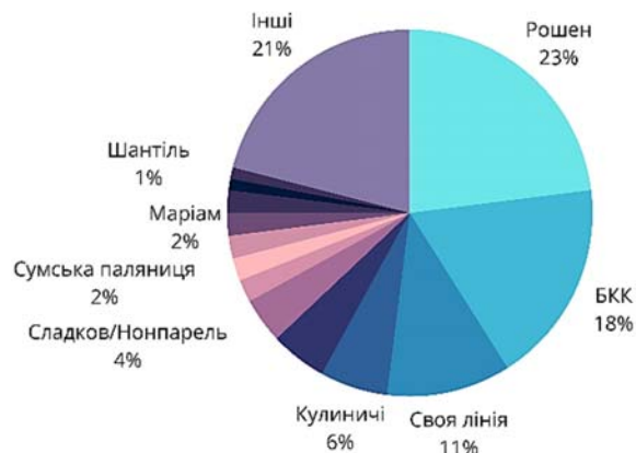
Рис. 3. Стан охоплення ринку м'яких кондитерських виробів

По-друге, українська галузь кондитерських виробів протягом останніх п'яти років характеризується тим, що 90% у частці ринку стабільно займають вітчизняні виробники. Відповідно до Звіту про управління ТОВ «Київський БКК» за 2022 рік, частка компанії на ринку м'яких кондитерських виробів складає 18%; розподіл часток учасників ринку зображений на Рис. 3.