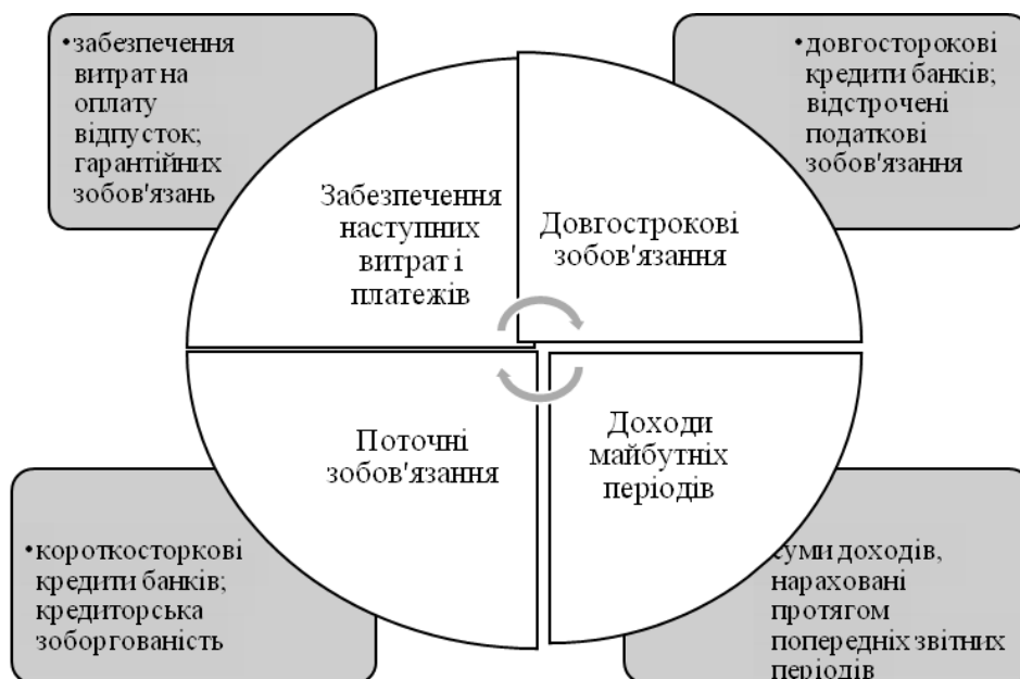
Рис.1. Склад зобов'язань агропродовольчого підприємства

Відповідно до П(С)БО 11 зобов'язання формують борг підприємства, що виникає внаслідок минулих подій і як факт, очікується погашення, що це призведе до зменшення накопичених ресурсів самого підприємства, в чому і виявляється економічна вигода [7]. На рисунку 1 наведено склад зобов'язань та характеристику їх елементів.