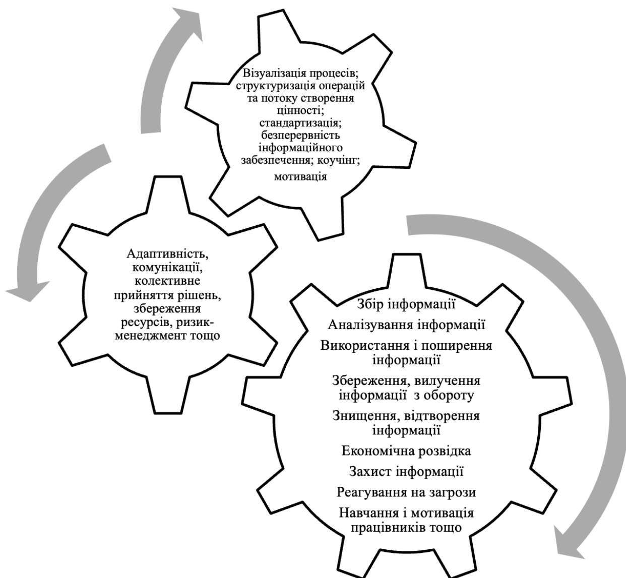
Рис. 3. Операційні процеси Agile-Lean підходу до інформаційного забезпечення використання інструментів економічного захисту підприємств в умовах міжнародної діяльності