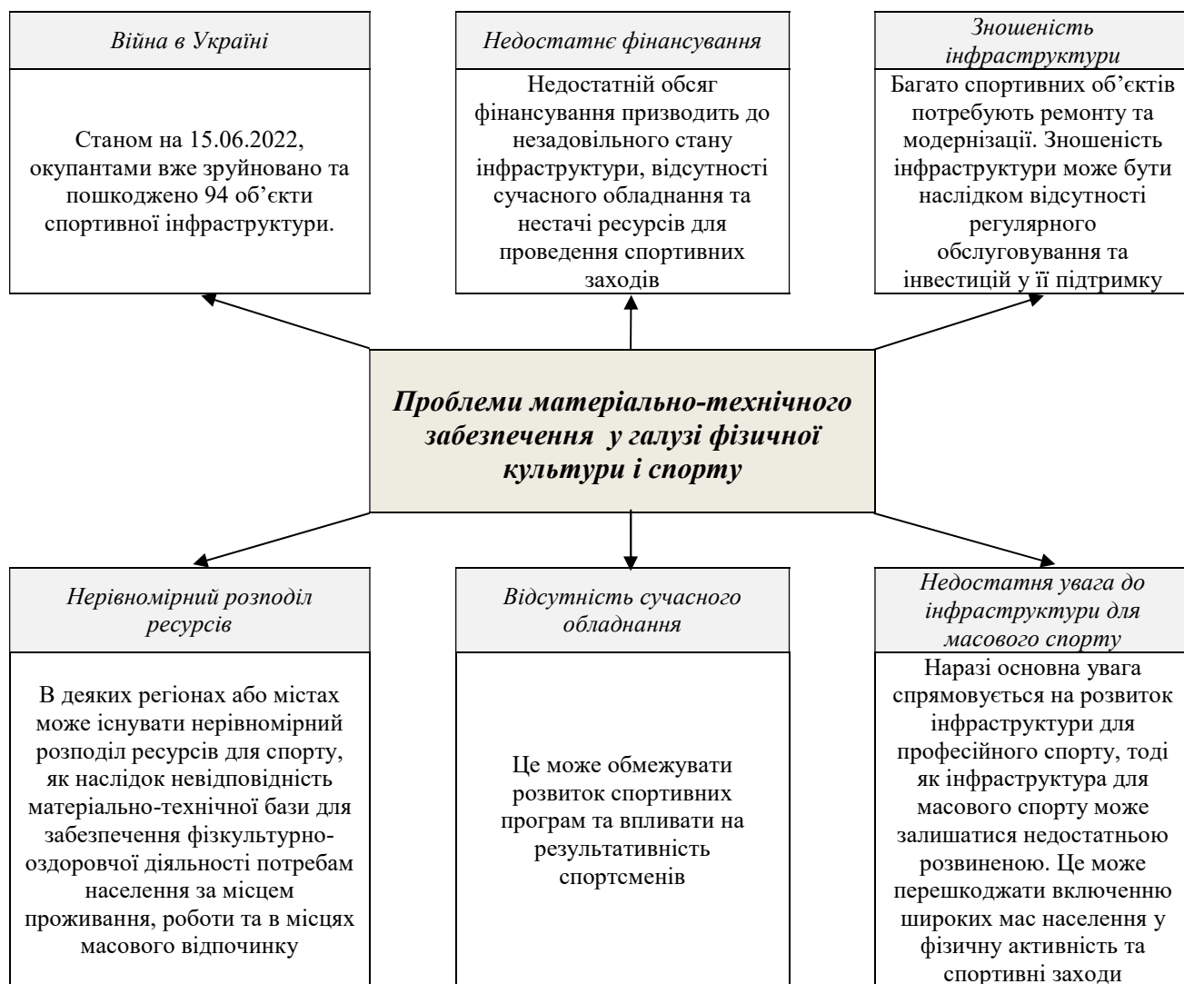
Рис. 4. Проблеми матеріально-технічного забезпечення галузі фізичної культури і спорту

Крім того, серед проблем матеріально-технічного забезпечення галузі фізичної культури і спорту можна зазначити недостатнє фінансування галузі, зношеність інфраструктури, нерівномірний розподіл ресурсів, недостатня увага до інфраструктури для масового спорту (рис. 4).