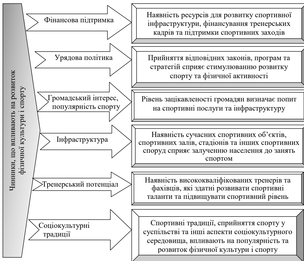
Рис. 1. Чинники, що впливають на розвиток фізичної культури і спорту

Розвиток фізичної культури і спорту в Україні піддається впливу різноманітних чинників (рис. 1).