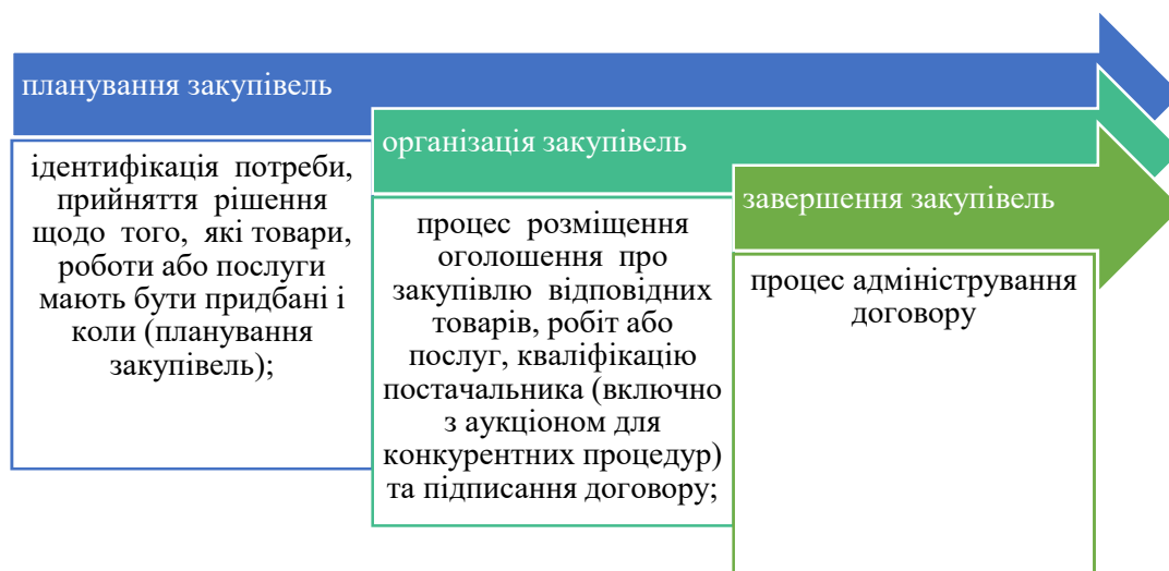
Рис. 2. Стадії процесу публічних закупівель

Щоправда, якщо ідентифікація потреби в закупівлі та адміністрування договору стосується виключно інтересів підприємства, то процес розміщення оголошення, проведення торгів та підписання договору торкається публічних інтересів. Саме тому другий етап публічних закупівель має чітке нормативне регулювання [16, с. 14].