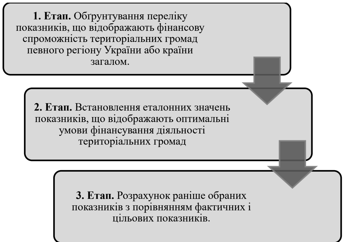
Рис. 1. Алгоритм оцінки фінансової спроможності територіальних громад

територіальних громад запропоновано алгоритм послідовних дій, основні етапи якого представлені нижче (рис. 1).