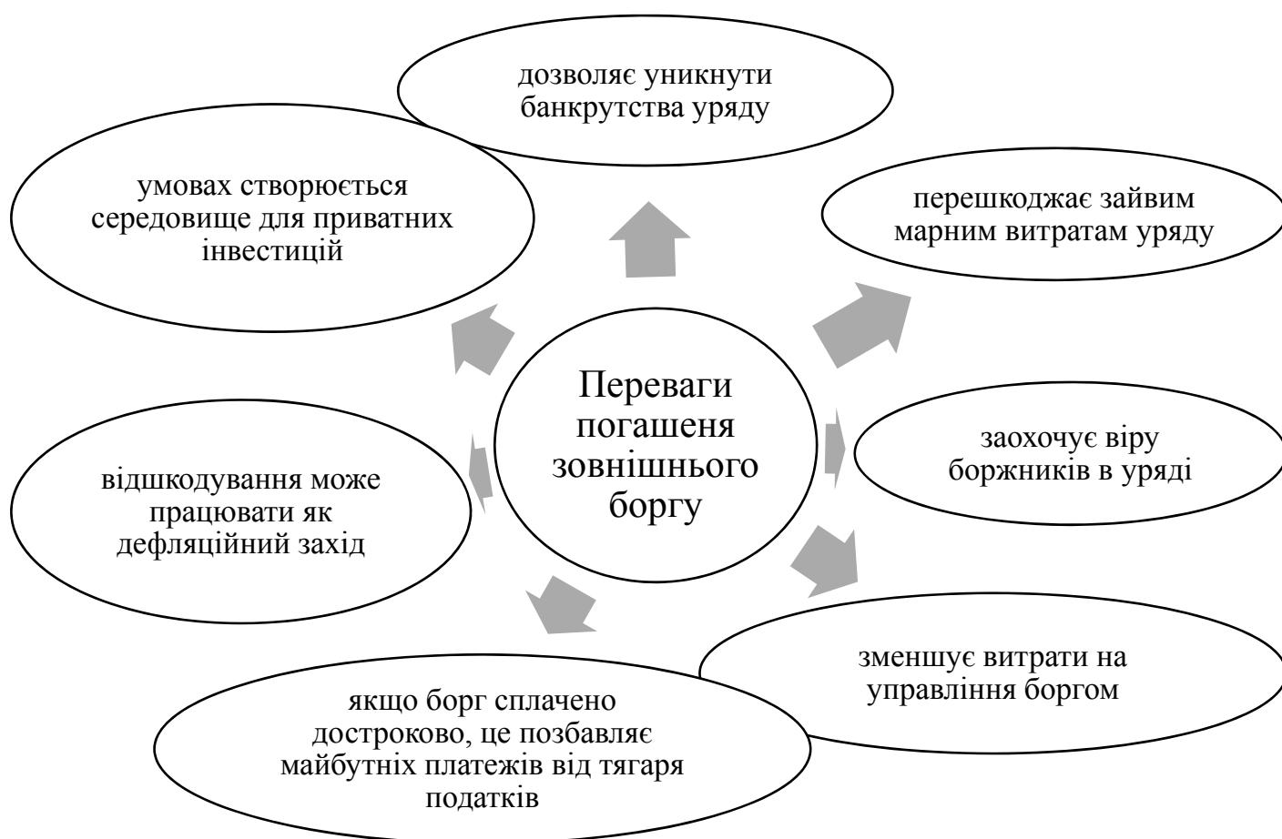
Рис. 3. Переваги погашення зовнішнього боргу

Підвищення податків є наступним методом зменшення державного боргу, уряди часто збільшують податки, щоб оплатити витрати. Податки можуть включати федеральний податок, податок штату та, в деяких випадках, місцевий податок на прибуток та підприємницьку діяльність. На рисунку 3 зображені переваги погашення зовнішнього боргу [8].