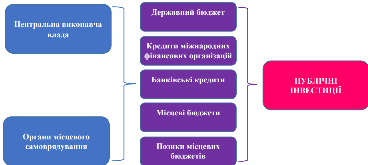
Рис. 1. Джерела коштів публічного інвестування в Україні

Базовою основою фінансового механізму публічного інвестування виступають кошти, котрі залучаються виконавчою владою та органами місцевого самоврядування з різноманітних джерел для фінансування видатків на розвиток інфраструктури, що в кінцевому підсумку трансформується інвестування (рис. 1).