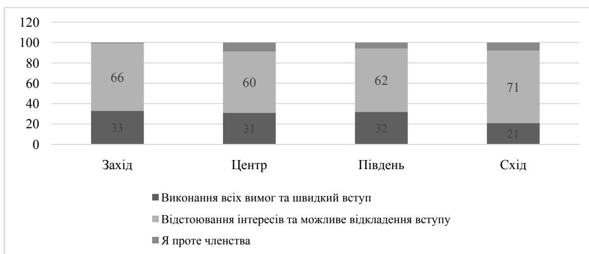
Рис. 2. Розподіл відповідей респондентів щодо ствердження про потребу виконання вимог ЄС в регіональному вимірі, 2022 рік

В українському суспільстві наявний консенсус щодо вступу до ЄС (81% підтримують вступ до ЄС), проте серед опитуваних 62% відзначають (Рис. 2), що України повинна відстоювати власні інтереси та не погоджуватися на окремі вимоги ЄС. 31% опитуваних відзначили, що Україна повинна схвалити потрібні закони, гармонізуючи законодавство, та стати членом ЄС. Прагнення до вступу до ЄС домінує серед населення України [12].