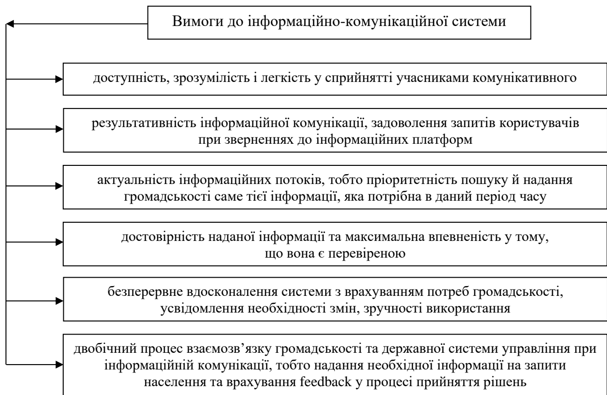
Рис. 2. Основні вимоги до формування інформаційно-комунікаційної системи, спроможної забезпечити резилієнтність громад