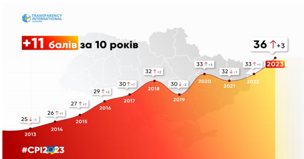
Рис. 1. Показники CPI України 2013-2023 рр.

посідала лідерські позиції в Європі щодо якості законодавства про доступ до інформації і в забезпеченні прозорості та підзвітності державних органів через інструменти доступу до публічної інформації» [15].