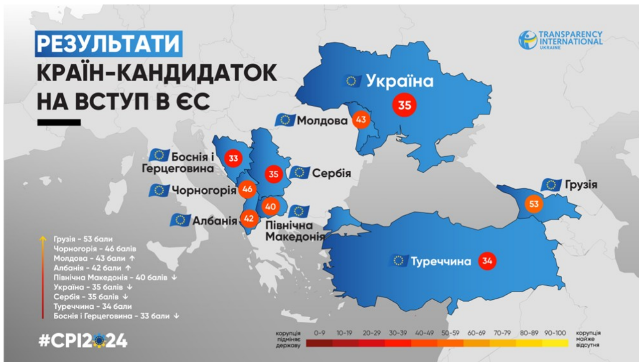
Рис. 2. Показник СРІ України та країн-кандидаток в ЄС у 2024 р.

балів – найгірший показник, тобто найвищий рівень корупції, натомість 100 балів означає відсутність корупції в країні. Тому зниження рівня корупції в СРІ України навіть на 1 бал означає не зменшення, а навпаки – збільшення її в країні, що зрештою погіршує сприйняття країни на міжнародному рівні, а отже сприймається як загроза економічній безпеці.