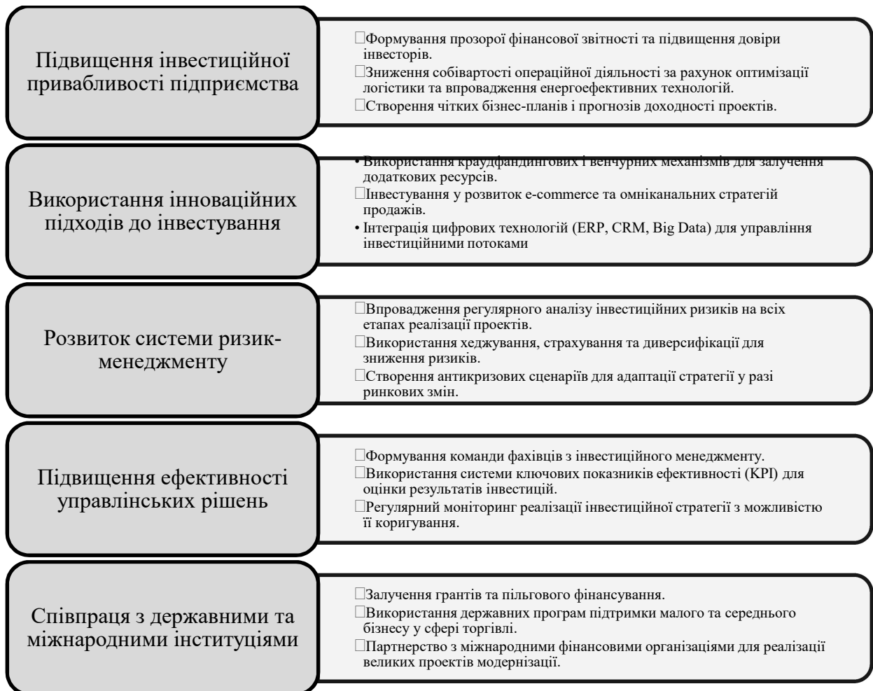
Рисунок 3. Основні напрями вдосконалення управління інвестиційною стратегією торговельних підприємств