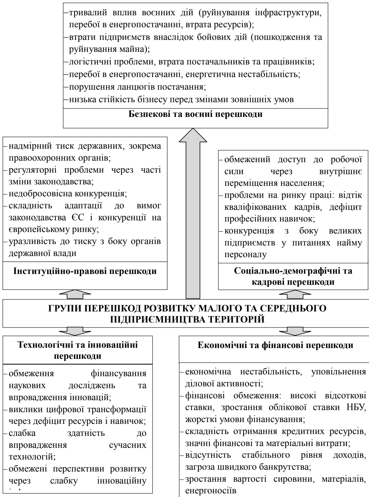
Рис. 2. Групи перешкод розвитку малого та середнього бізнесу територій