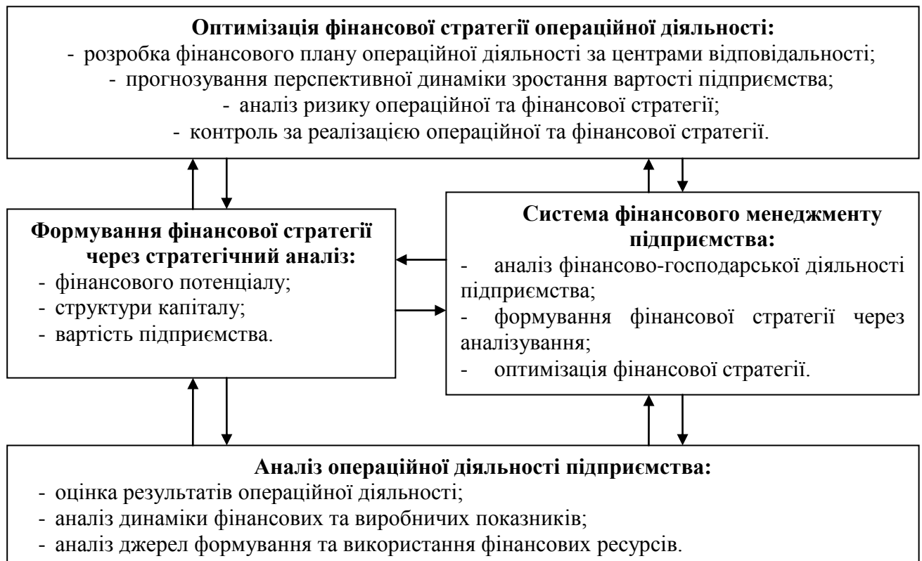
Рис. 2. Структурно-логічна схема дослідження впливу оптимальної організації системи фінансового менеджменту на стратегічний аналіз операційної діяльності підприємства