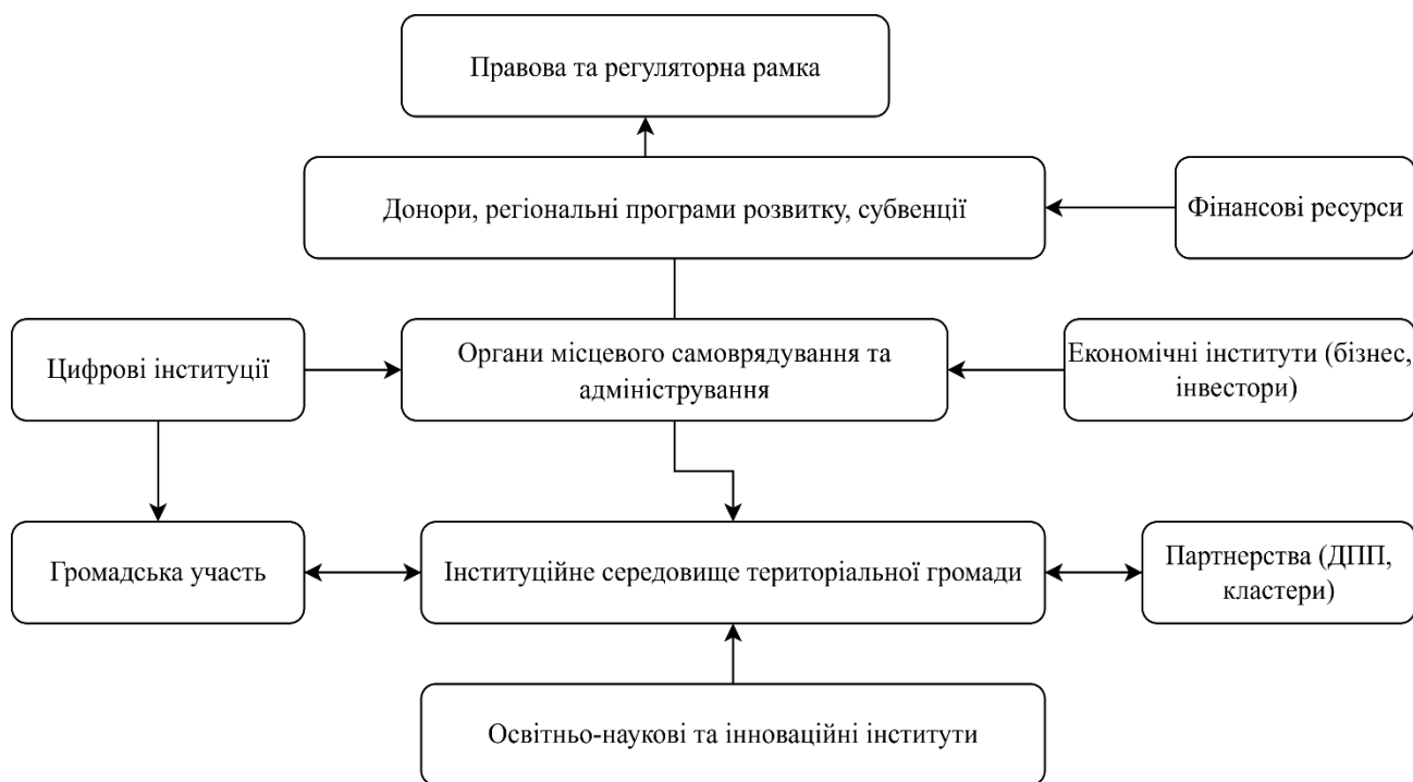
Рис. 2. Схема інституційного середовища територіальної громади

адміністративну координацію та реалізацію публічних рішень; економічні інститути – мобілізацію ресурсів, розвиток бізнесу та інвестицій.