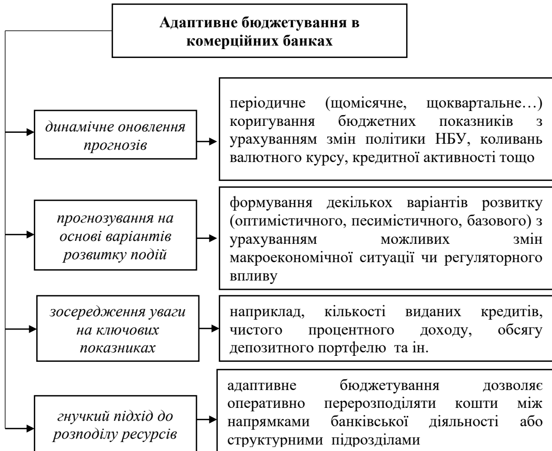
Рис. 2 Особливості використання адаптивного бюджетування в комерційних банках

управлінської гнучкості в межах банківської установи. Впровадження цього підходу вимагає не лише технологічних змін, а й трансформації мислення управлінського персоналу: від контролю за планом - до управління за прогнозом. До особливостей використання адаптивного бюджетування системою управлінського обліку в комерційних банках слід віднести (рис. 2):