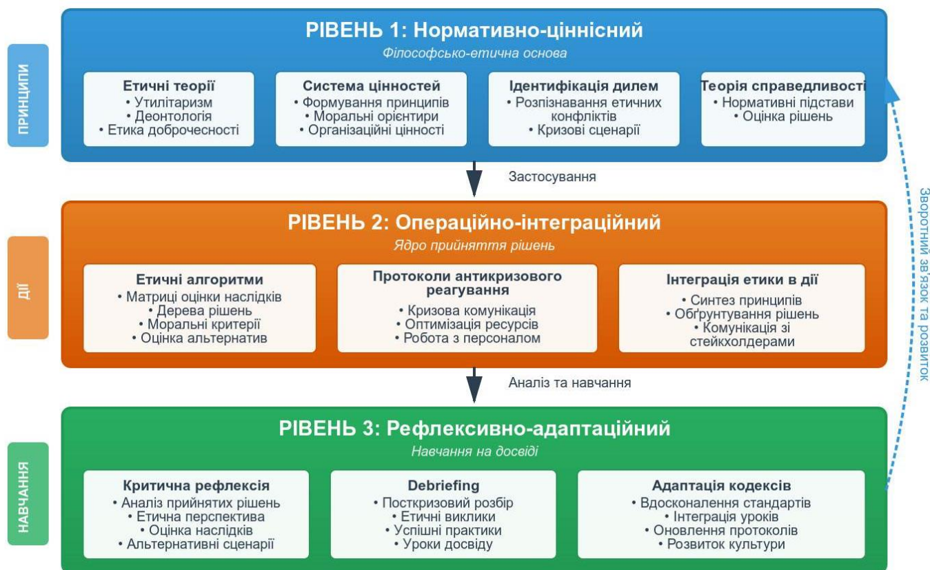
Рис. 1. Концептуальна рамка синтезу етики та антикризового управління

Структура запропонованої концептуальної рамки зображена на рис. 1.