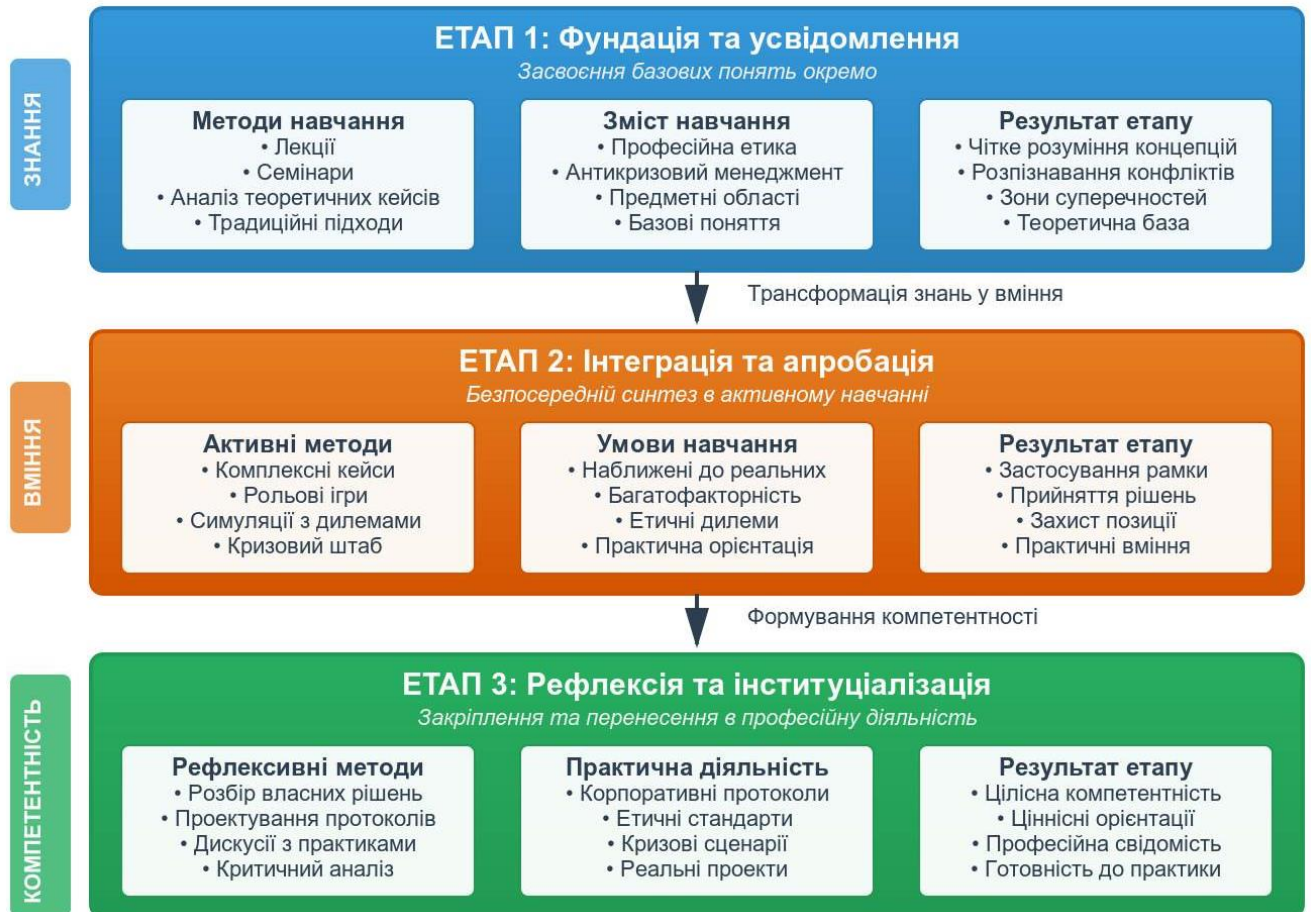
Рис. 2. Модель поетапного впровадження етико-антикризової складової в освітню програму

«кризовий штаб»), комп'ютерні симуляції з етичними дилемами. Студенти в умовах, що наближені до реальних, навчаються застосовувати концептуальну рамку для прийняття та захисту рішень.