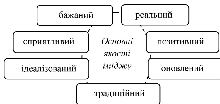
Рис.1. Основні якості іміджу

До основних характеристик іміджу (рис. 1) можна віднести бажаний, традиційний, реальний, сприятливий, позитивний, ідеалізований і оновлений імідж, однак ці поняття більше відображають окремі якості іміджу, ніж його самостійні різновиди [3].