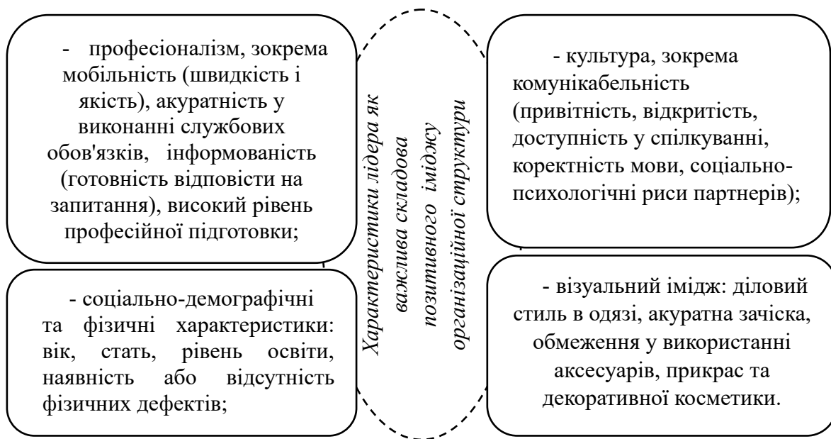
Рис. 4. Характеристики лідера як важлива складова позитивного іміджу