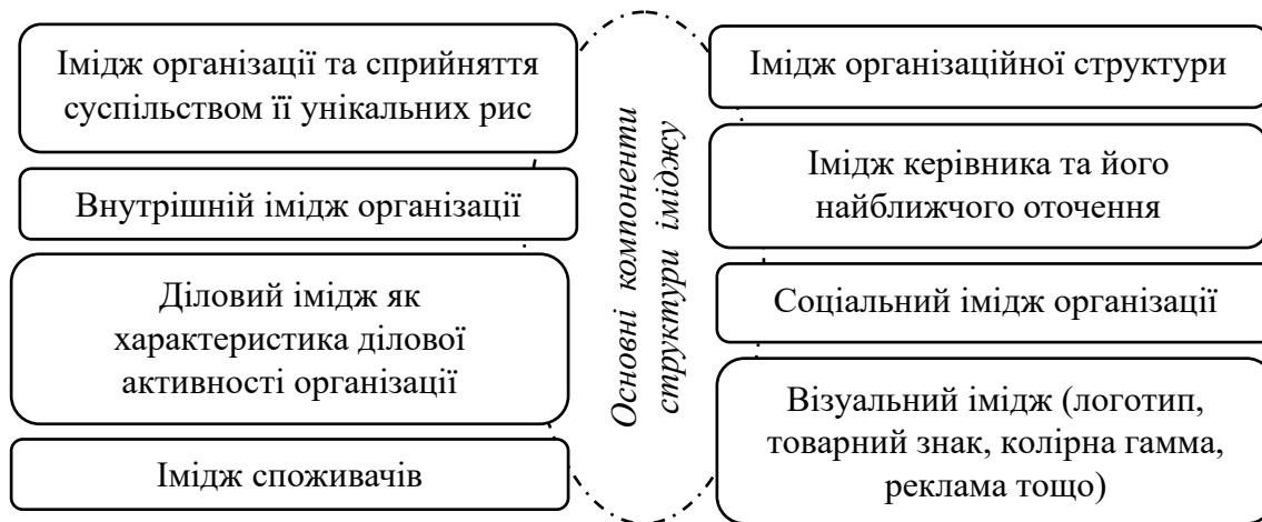
Рис. 3. Структура іміджу