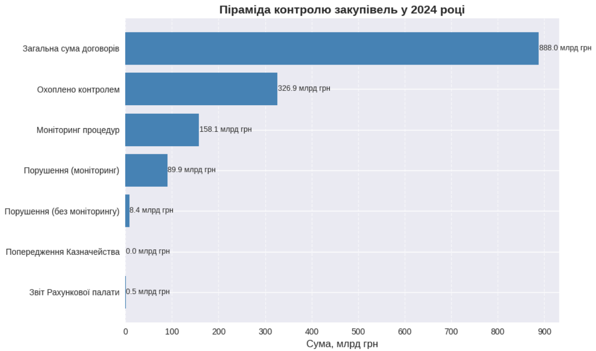
Рис. 2. Піраміда контролю такого предмету контролю як публічні закупівлі, за 2024 рік

Джерело: Систематизовано, узагальнено та згруповано за даними [2,5,9,10].