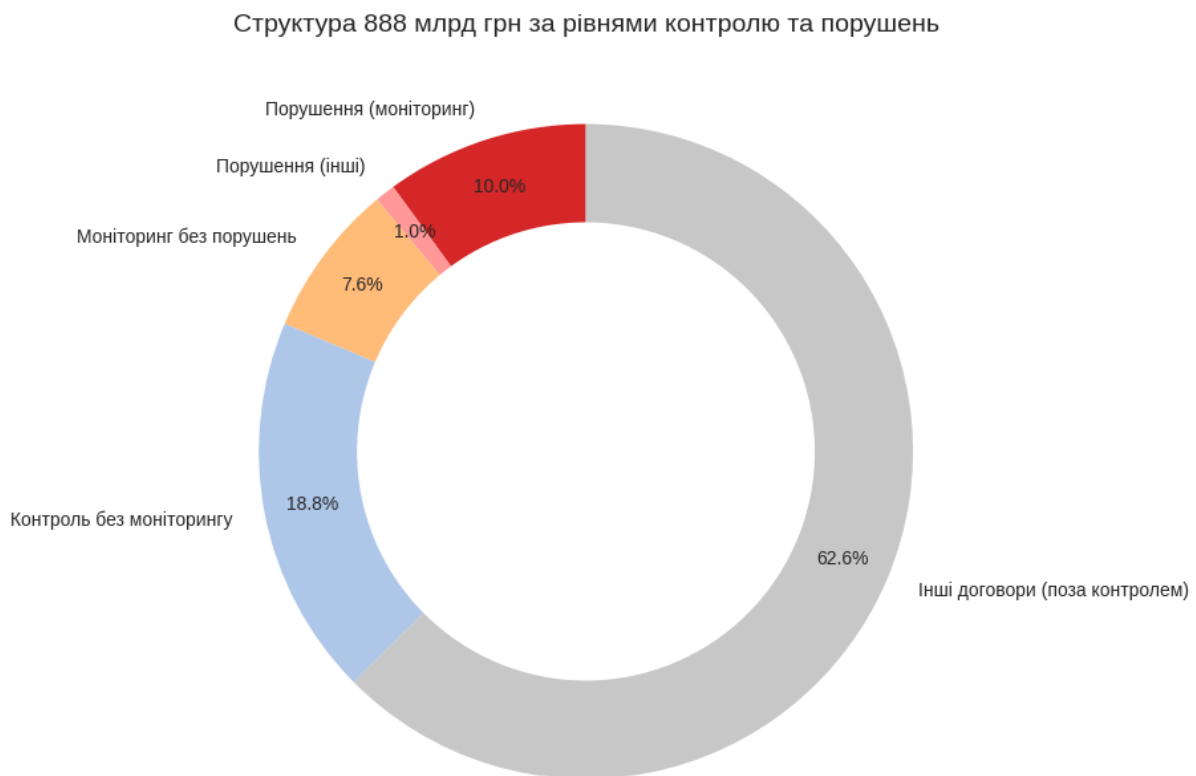
Рис. 1. Вартісний вираз предмету контролю за таким складовим як публічні закупівлі – його Структура за рівнями контролю та порушень, за 2024 рік

Задля наочності отриманих представлених результатів, візуалізуємо їх (Рис.1, Рис. 2, Рис. 3).