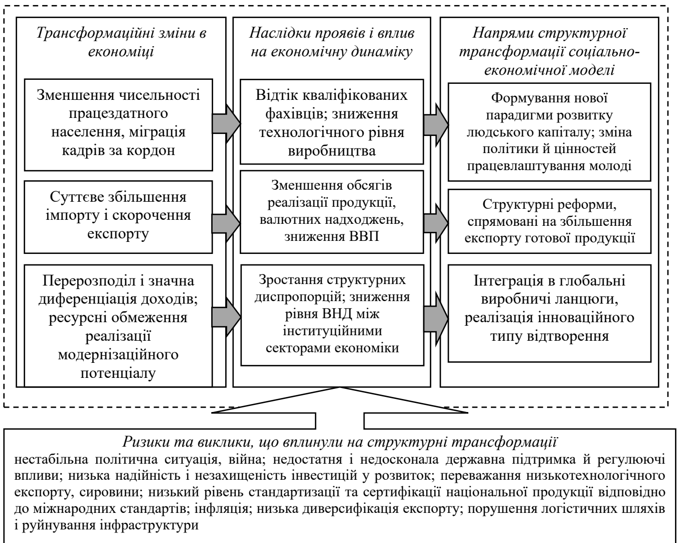
Рис. 2. Напрями структурної трансформації національної економіки

Окрім ендогенних факторів на реалізацію модернізаційного потенціалу впливають екзогенні чинники, які, в значній мірі, обумовлені глобальними впливами й циклічною динамікою. За умов неможливості адаптації до кризових проявів екзогенного характеру економіка втрачає темпи розвитку, що супроводжується різким скороченням ВВП, інвестиційної активності, виробничих потужностей, втратами людського капіталу, скороченням внутрішнього попиту. Проведені дослідження структурних трансформацій економіки з урахуванням та оцінкою кризових ситуацій, що відбувалися в країні протягом 2014-2024 рр. дозволили запропонувати ключові напрями структурних трансформацій, які сприятимуть модернізації національної економіки (рис. 2).