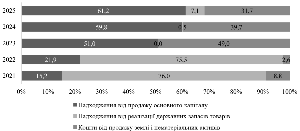
Рис. 3. Структура доходів від операцій з капіталом державного бюджету України за 2021-2025 рр., %

Джерело: систематизовано, узагальнено та згруповано за даними [11].