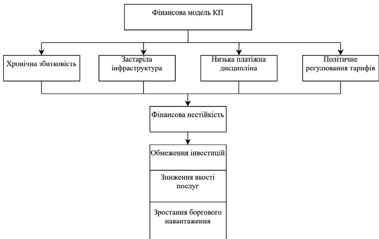
Рис. 1. Логіко-структурна модель ключових проблем фінансової стійкості КП

Важливу роль відіграє інформаційна асиметрія як всередині підприємств, так і у взаємодії з зовнішніми стейкхолдерами, що підвищує ризики та знижує довіру [6, с. 102]. У сукупності ці фактори обмежують здатність підприємств до розвитку та залучення